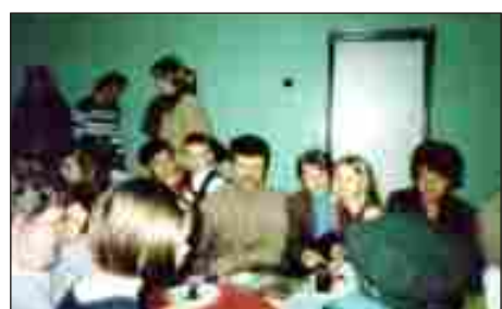
Spotkanie na sali gimnastycznej