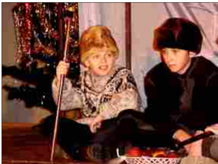
Zespół Figla z SP Osuchów