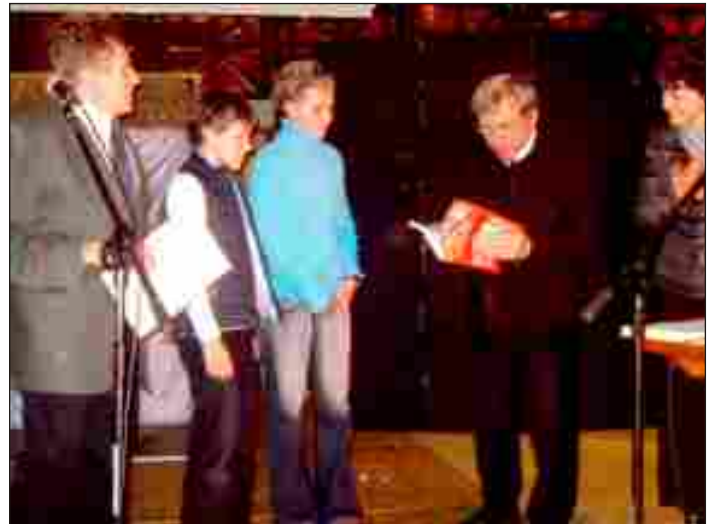
Nagroda za najlepszą interpretację postaci scenicznej, wśr