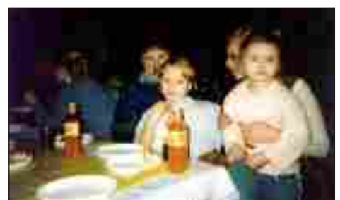
Kochamy nasze Babcie

Najlepsi uczniowie w szkole ze średnią 4,5 i wyżej za I okres r. szk. 2004/20045w kl. 4-6.