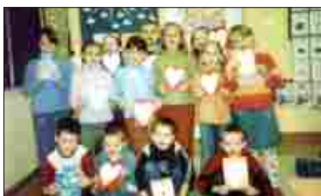
Przygotowania do Święta Babci i Dziadka