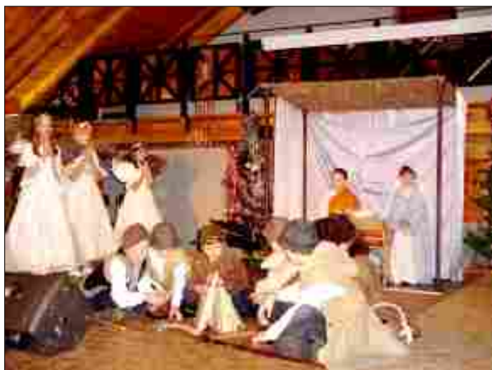
Jury ocenia występ grupy teatralnej Bajka z SP Węcza