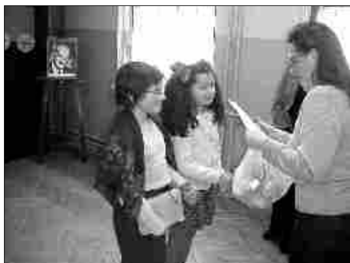
... i konkursu teatralnego