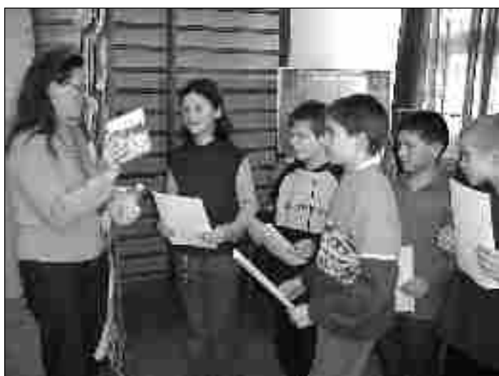
Zwycięzcy konkursu plastycznego...