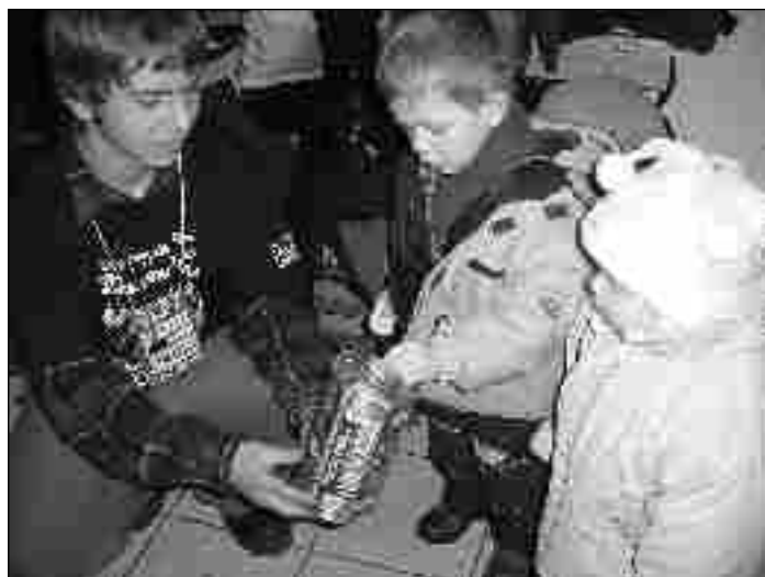
Mszczonowianie potrafią być hojni