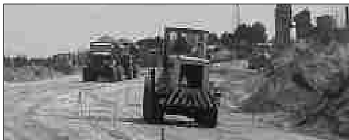
W minionym roku rozpoczęto najbardziej wyczekiwaną inwestycję - budowę obwodnicy