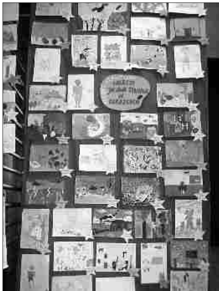
Prace przygotowane na konkurs plastyczny

Dlatego, gdy dotarła do naszej Szkoły informacja o nowym programie pod nazwą „Czytające szkoły”, zainicjowanym przez