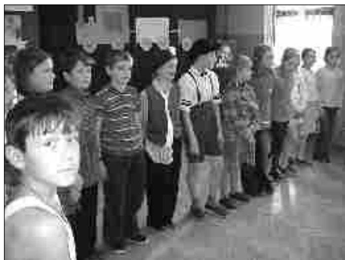
Zespoły teatralne klasy "0" i klasy IV