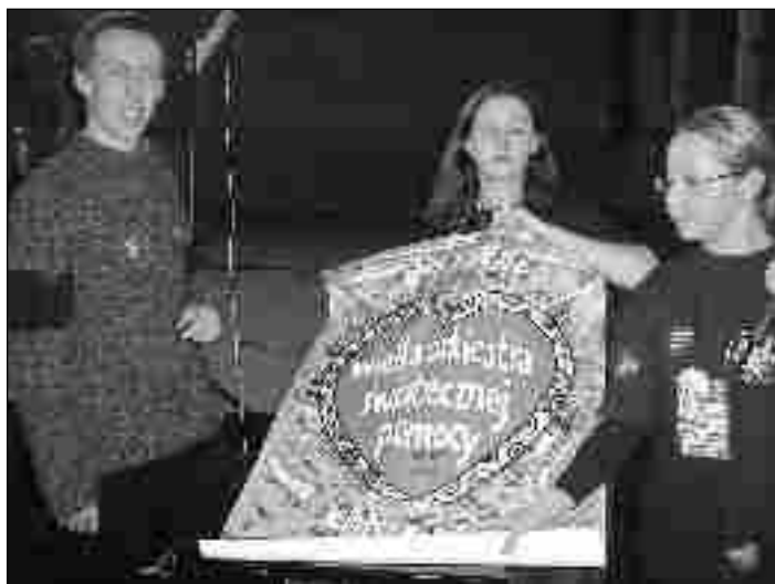
Odbiór wylicytowanego plakatu z podpisami organizatorów