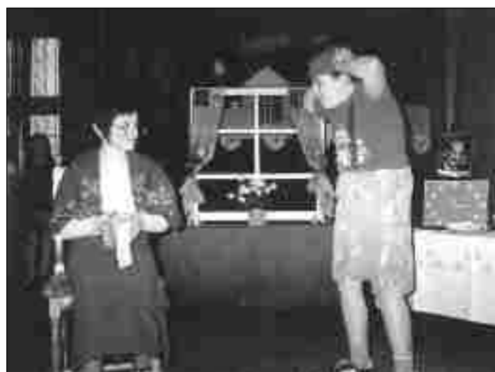
Sceny z przedstawienia