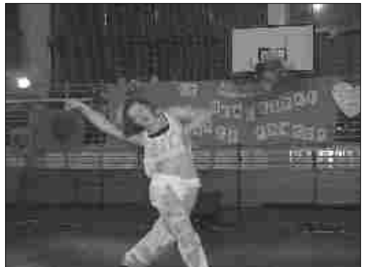
Publiczność mogła podziwiać występy artystów z Formacji Tańca Disco