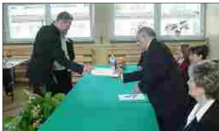
Przewodniczący klas sprawdzają pieczęcie na kopercie z maturalnymi tematami