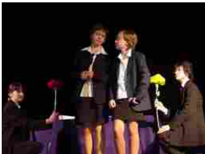
Teatr KLESIK - SP Lutkówka