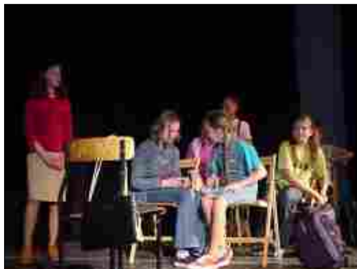
Teatr KAJTEK - SP Piekary