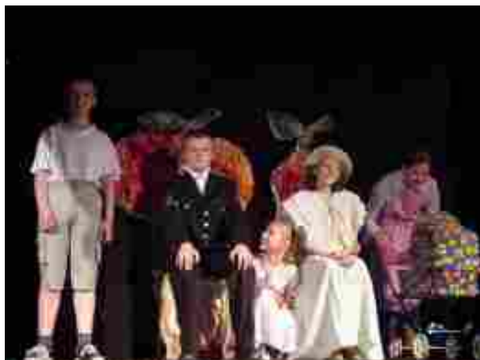
Teatr TABALUGA - SP Mszczonów

XII Spotkania Artystyczne Szkół (20 maja 2004r.) Mszczonowski Ośrodek Kultury