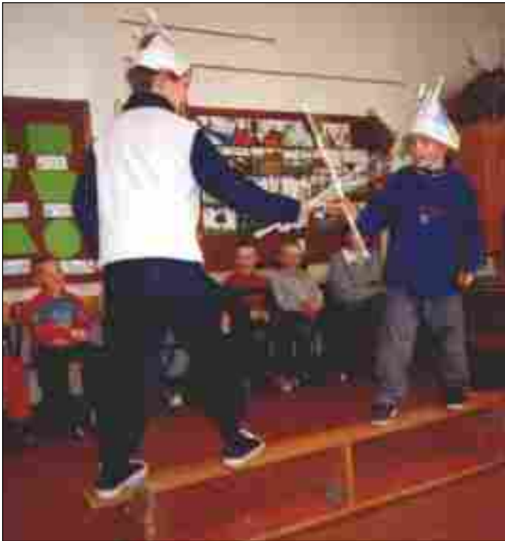
Pojedynek szwedzkich wikingów