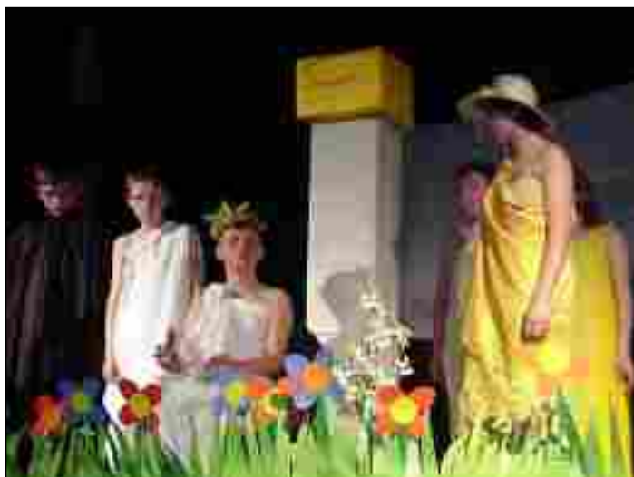
Teatr ARLEKIN - SP Bobrowce

Drugie miejsce w kategorii szkół podstawowych zajęła grupa teatralna KAJTEK ze Szkoły Podstawowej z Piekary, która zaprezentowała przedstawienie