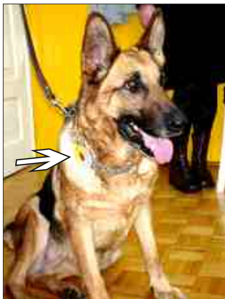
Znaczek z biedronką dla nowego honorowego przedszkolaka