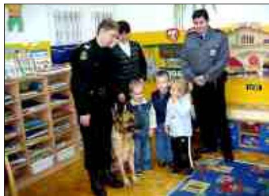
Na zakończenie przyszedł czas na mini sesję fotograficzną