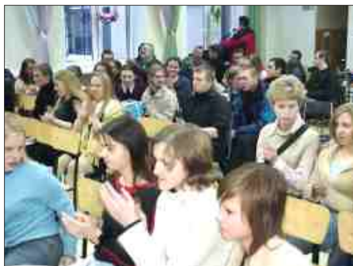
Publiczność na Strunie nie zawiodła