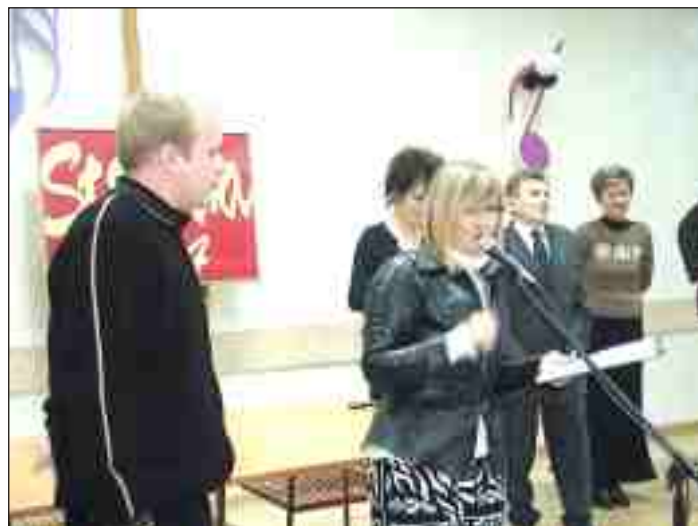
Gratulacje dla wokalisty THE TOWN