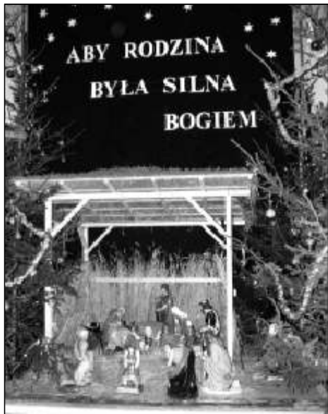
Mszczonów - parafia p.w. Świętego Jana Chrzciciela

domach. Wielu z nas umieszcza je pod choinką, gdzie tłem dla nich są słomiane lub drewniane imitacje stajenek. Postacie Świętej Rodziny, trzech mędrców oraz pasterzy i zwierząt od setek lat pozwalają najmłodszym poznawać historię, która wydarzyła się przed przeszło dwoma tysiącami lat. Największą frajdą dla dzieci są żywe szopki, do których urządzenia używane są prawdziwe zwierzęta. Od kilku lat taką właśnie żywą szopkę oglądać można przed dużym kościołem w Żyrardowie. W świątyniach zlokalizowanych na terenie gminy Mszczonów ustawiane są tradycyjne szopki z ceramicznymi figurami. W kaplicy nowej Parafii p.w. Świętego Ojca Pio obok nich znalazło się także wiele pluszowych maskotek, które jeszcze bardziej przyciągały do niej dzieci. W kościele farnym p.w. Świętego Jana Chrzciciela starą stajenkę zastąpiono całkowicie nową konstrukcją. Poprzednia była masywniejsza i bardziej przypominała prawdziwą, drewnianą budowlę. W tle umieszczono wymowne hasło - „Aby rodzina była silna Bogiem”. Szopka w Lutkowie jest mała i przytulna jak sama miejscowa świątynia, a otaczające je świerki także nieco przypominają las, który otacza lutkowiecki kościół. Szopka w Osuchowie posiada pięknie wymalowane tło, na którym widać stare Betlejem. Wszystkie stajenki mają swój niepowtarzalny urok. Trudno sobie bez nich wyobrazić Świąta. Wrosły na stałe w naszą kulturę i tradycję.