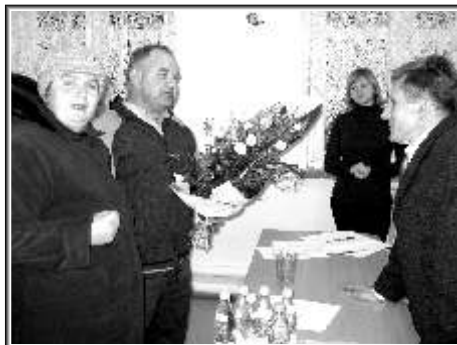
Spotkanie z mieszkańcami Piekar

remont wciąż oczekuje trasa Mszczonów - Piekary - Osuchów - Bobrowiec (szczególnie zniszczony jest odcinek od Mszczonowa do Osuchowa). Burmistrz obiecywał, że będzie naciskał w tej kwestii na władze powiatu, jednak nie mógł teraz podać żadnego przypuszczalnego terminu rozpoczęcia tak poważnej modernizacji. Gdyby jednak udało się ją przeprowadzić w roku 2010 to wtedy