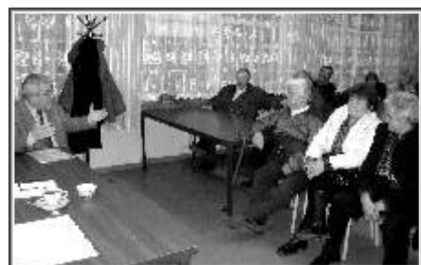
Spotkanie w Osuchowie

kłopoty ze spadkami napięcia elektrycznego (okolice Bobrowiec), brak ogrzewanego przystanku autobusowego w Mszczonowie i zanieczyszczanie lasów, przydrożnych rowów i przystanków autobusowych tonami śmieci. Ten ostatni temat spowodował powrót do „przerabianej” od trzech lat dyskusji na temat potrzeby budowy spalarni. Kilka osób zarzuciło samorządowi, że dąży do zrealizowania tej inwestycji nie bacząc na zdrowie mieszkańców. Burmistrz i radni ponownie zapewniali, że spalarnia nie stwarza żadnego zagrożenia i powoływali się przy tym na opinie naukowców, odwiedzających Mszczonów w 2006 roku, a poza tym