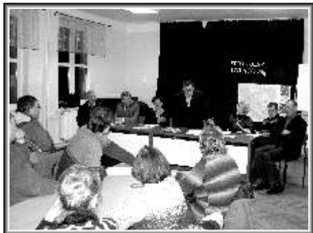
Spotkanie w Lutkówce

W tym roku spotkania rozpoczęto od terenu wiejskiego. Pierwsze z nich odbyło się 1 grudnia w Lutkówce. Następne miały miejsce w Piekarach (2.12), Osuchowie (3.12) i Bobrowcach (7.12). Każde zdominowane było tematem stanu dróg gminnych i powiatowych. Sieć komunikacyjna południowej części gminy Mszczonów opiera się na kilku drogach powiatowych. Część z nich została już zmodernizowana, ale wiele jest jeszcze do zrobienia. Tuż przed spotkaniem w Lutkówce dokończono remont odcinka Osuchów - Lutkówka. Mieszkańcy wyrazili zadowolenie z wykonania od dawna oczekiwanego przedsięwzięcia i dopytywali, czy przy okazji zostaną także poprawione pobocza drogi. Usłyszeli, że tak się stanie i rzeczywiście w niedługim czasie prace przy umacnianiu poboczy ruszyły pełną parą. Na