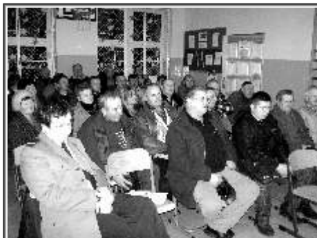
Rozmowa z mieszkańcami Bobrowiec

Mieszkańcy zgłaszali przedstawicielom samorządu także takie sprawy jak: brak opieki stomatologicznej na terenach wiejskich, nieopłacalność produkcji rolniczej, plaga dzików niszcząca uprawy,