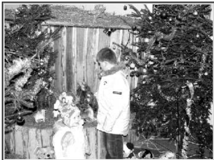
Mszczonów - parafia p.w. Świętego Ojca Pio