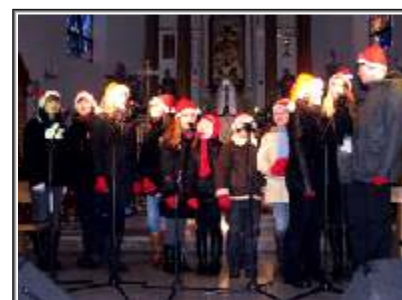
Studio Piosenki WOKALIZA

Podziękowała publiczności za przybycie do kościoła, księdzu dziekanowi za udostępnienie świątyni, a artystom za występ, Pani dyrektor złożyła też wszystkim życzenia Szczęśliwego Nowego 2010 Roku.