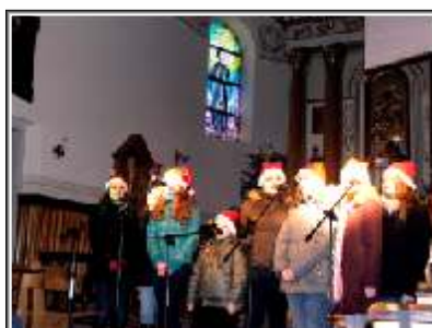
Grupa Wokalna VOICE