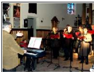
Męski Chór Parafialny