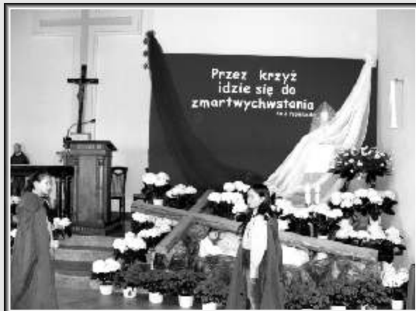
Kaplica parafii p.w. Św. Ojca Pio w Mszczonowie