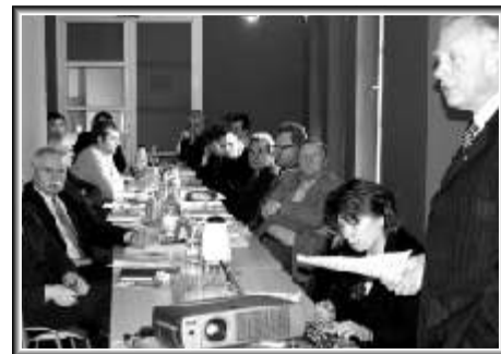
Uczestnicy jednego z poprzednich szkoleń