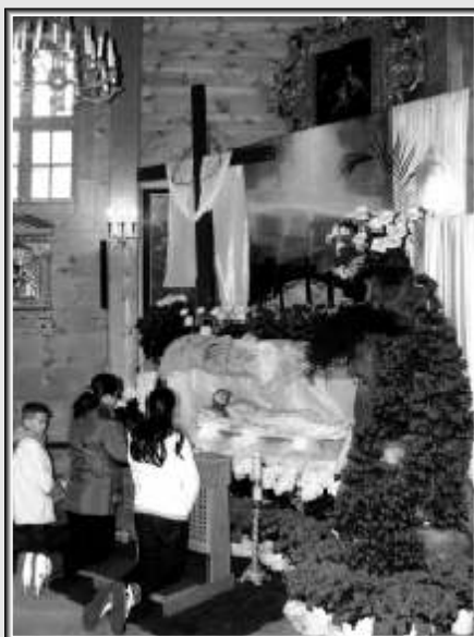
Kościół w Lutkówe