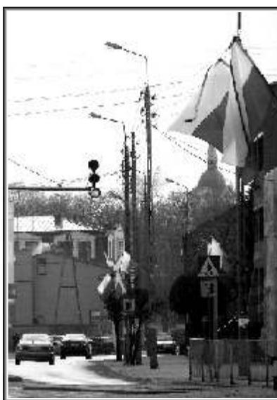
Smutek i żal mszczonowian po śmierci naszych rodaków symbolizowały żałobne flagi