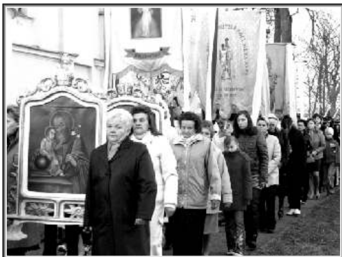
Procesja rezurekcyjna w parafii Św. Jana Chrzyciela