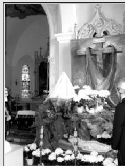
Kościół w Osuchowie