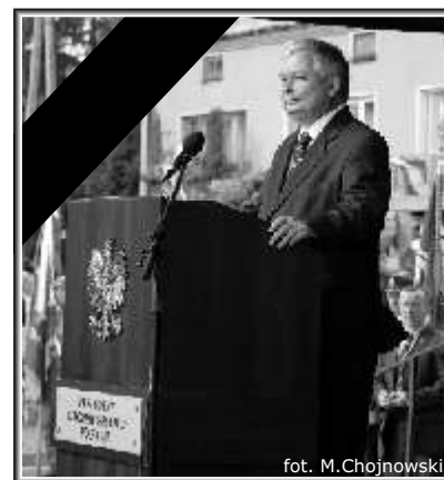
fol. M. Chojnowski