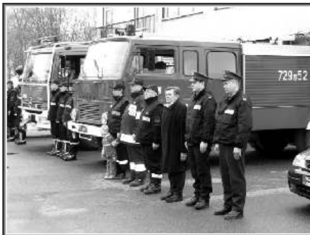
Hołd oddany zmarłym, w południe 11 kwietnia, przez mszczonowskie służby mundurowe