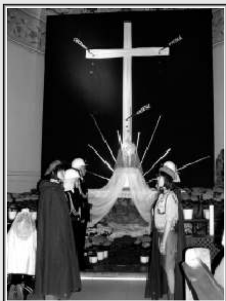
Kościół farny w Mszczonowie