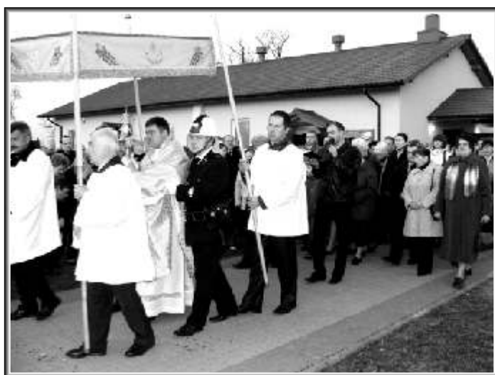
Procesja rezurekcyjna w parafii Św. Ojca Pio

postępuje kapłan niosący monstrancję z konsekrowaną Hostią. Procesja okrąży kościół trzykrotnie. Po wejściu do świątyni wierni śpiewają Te Deum.