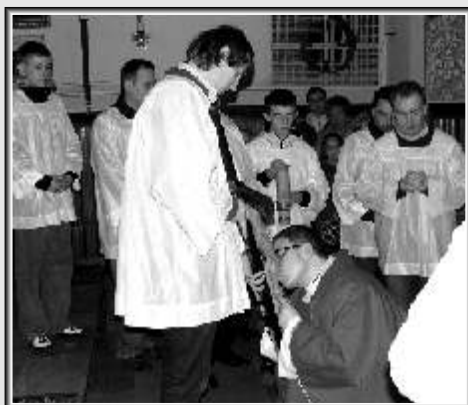
Adoracja Krzyża (parafia Św. Jana Chrzciciela)