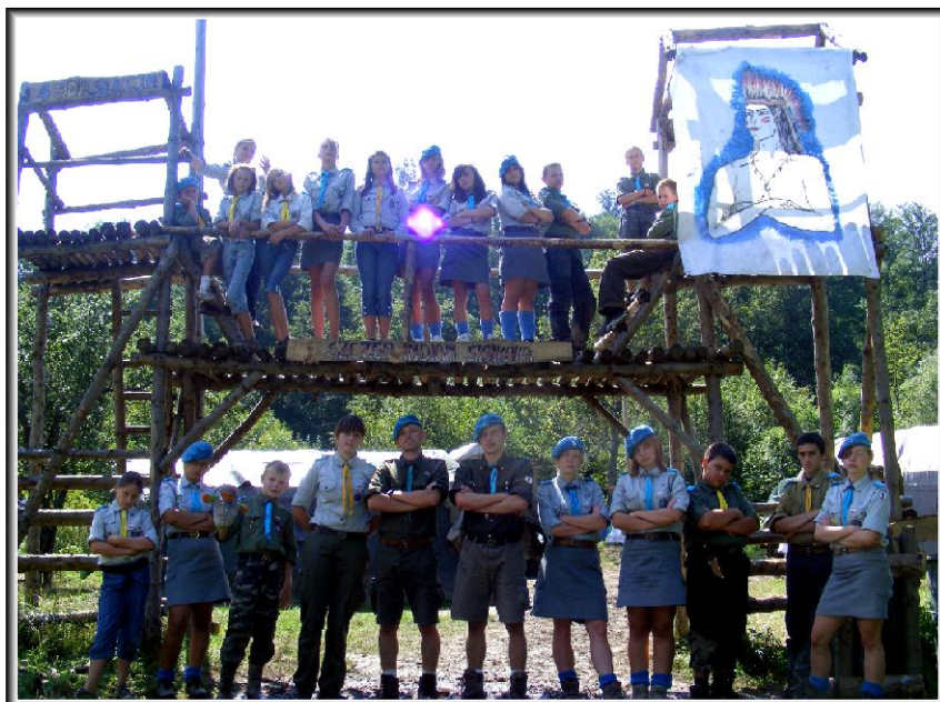
W bramie obozowej

W ciągu dwóch tygodni wspólnego działania i podsumowywania roku harcerskiego 4 S.D.H. „S.E.K.C.J.A.” zorganizowała kilka ognisk harcerskich i nie tylko na których gościliśmy innych harcerzy m.in. z Torunia i Sierpca oraz kadrę zgrupowania. W ciągu dnia druhni i druhowie uczyli się w ciekawy sposób podstawowych technik harcerskich, były więc zajęcia z symboliki i struktury, pierwsza pomoc czyli samarytanka, jak również zajęcia z musztry. Harcerze zapoznali się także z Prawem i Przyrzeczeniem harcerskim. Nie zabrakło także technik które mogą każdemu przydać się w codziennym życiu, było więc terenoznawstwo - nauka posługiwania się busola i kompasem, poruszanie się z mapą, określanie kierunków i zajęcia z pionierki- budowanie kuchni polowej, układanie ognisk, budowanie szałasów itp. Ponadto harcerze uczestniczyli w kilku grach terenowych, które podrasowały ich jako obserwatorów, nauczyły skradać się i w ciekawy sposób wykorzystywać swój spryt i odwagę; przy okazji oczywiście było wiele zabawy i radości podczas maskowania się, czołgania i biegania po górach. Podczas zajęć z szycia każdy wyszył sobie pagony drużyny i imię alfabetem morsa na mundurze. Na zajęciach z braterstwa wszyscy obsypywali siebie miłymi słowami i wydobywali z siebie i innych wiele pozytywnych cech, a na zajęciach