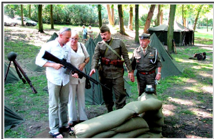
Mszczonowanie w obozie Strzelców Kaniowskich