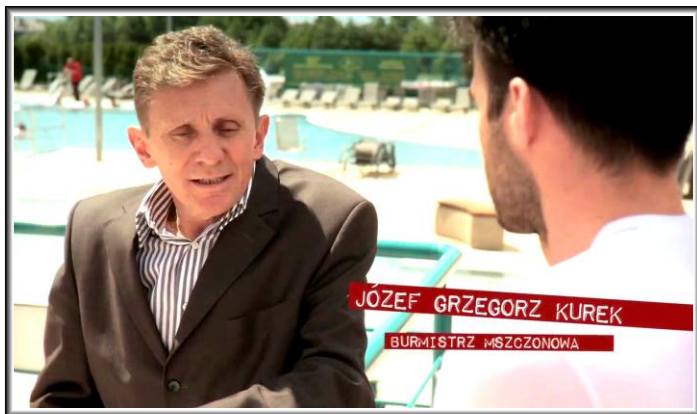
Kadr z programu „Polska Pięknieje - 7 Cudów Funduszy Europejskich”