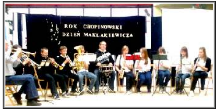
Koncert Orkiestry Dętej