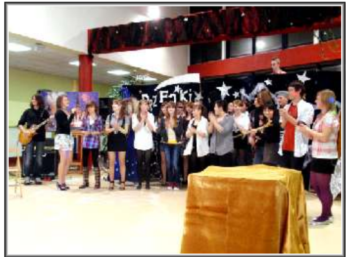
Rety, Ludzie, nie do wiary Jakie tutaj były czary!

Rodziców, uczniów oraz nauczycieli zapraszamy na wspólną zabawę również za rok!