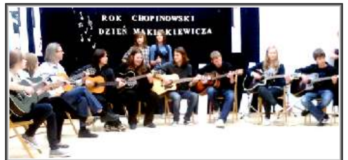
Koncert na dziewięć gitar