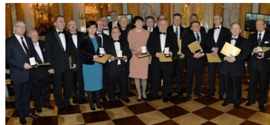
Laureaci odznaczeni Złotymi Medalami APS

Polskiego Sukcesu powstała w 2000 roku pod patronatem Stowarzyszenia Polski Klub Biznesu. Dyplomy i medale przyznała już 400 osobom: ludziom biznesu, nauki, kultury i sztuki oraz sportu. Akademię tworzą ludzie, sukcesy swoim przykładem dowodzą, że sukces, także na międzynarodową, światową skalę, leży w granicach możliwości polskich przedsiębiorców, artystów, sportowców, którzy swoim przykładem mogą zachęcić innych do sięgania po laury. Oprac. Łukasz Nowakowski