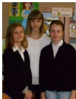
Zdjęcie zwycięskiej drużyny.

P r a c e plastyczne i i n f o r m a c j e o konkursie wywieszono na głównym korytarzu szkolnym w